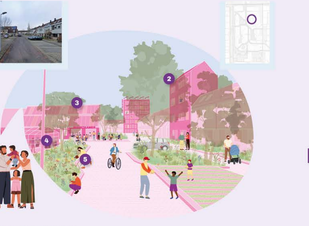
Beeld 3: Een diverse buurt is... 1. ... een emancipatiemachine waar starter oud kan worden. 2. ... herkenbaar door sterke identiteit van openbare ruimte en gebouwen. 3. ... energieneutraal voor een lage energierekeningen en comfortabel wonen. 4. ... collectief met voldoende ruimte voor initiatieven van bewoners. 5. ... compact met veel ontmoetingen, groen en woningen op korte afstand.

Drie beelden tonen de potentie van een samenredzame wijk op ooghoogte. Een toekomst waarin de diversiteit van Overbos wordt benut om kansen te bieden voor de bewoners van de wijk. Een toekomst waarin bestaande ankerpunten worden versterkt tot harten van de gemeenschap en nieuwe ankerpunten worden toegevoegd om op lokale behoeftes en opgaven in te spelen.