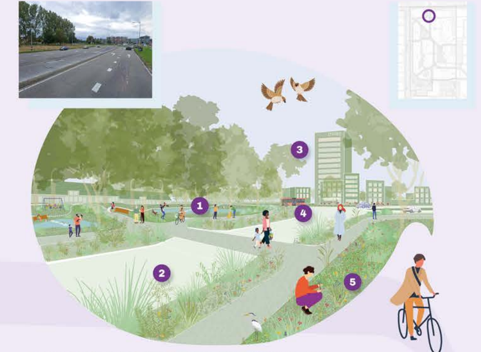
Beeld 1: Een groene en gezonde corridor van de toekomst is... 1. ... gezond met ruimte voor beweging en ommetjes. 2. ... verbonden door goede routes en verbinding met elders. 3. ... aantrekkelijk door heldere adressering en herkenbare architectuur. 4. ... in balans met mobiliteit op maat passend per structuur. 5. ... klimaatadaptief door inrichting afgestemd op mens en dier.

Om werk te maken van deze slimme programmering is het bezit van de corporatie een belangrijke sleutel en vormt verdichting het perfecte middel. Zo kan elke Overbosser een leven lang in eigen buurt blijven wonen!