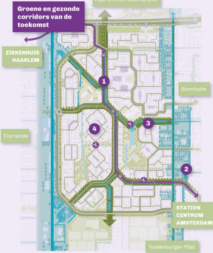
Groene en gezonde corridors van de toekomst 1. ... Stadsas die de wijk met stad en regio verbindt. 2. ... Polderlinten die de wijk met de parken verbindt. 3. ... Wijkaders die buurten verbinden. 4. ... Leefstraten die mensen verbinden.

Het derde beeld laat zien dat op buurtniveau een belangrijke sleutel ligt om meerdere opgaven tegelijkertijd aan te pakken. Denk hierbij aan bewonersdifferentiatie, vergroening, verduurzaming, compact bouwen, ruimte voor bewonersinitiatieven en het creëren van toegankelijke, herkenbare ontmoetingsplekken voor alle doelgroepen. Door doelgroepen niet langer te scheiden op wijkniveau, maar te mixen binnen de buurt ontstaan spontane ontmoetingen en kunnen jongeren en ouderen in hun vertrouwde omgeving blijven wonen. Door parkeren slim te clusteren wordt ruimte vrij gespeeld voor groen en wonen.