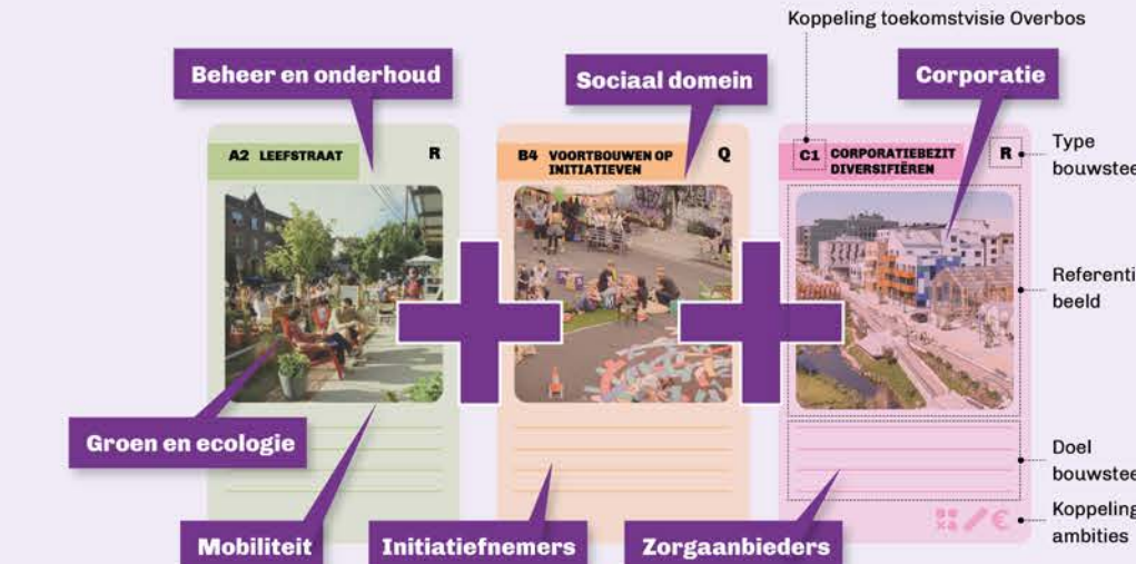
Beeld: Bij grote golven is het mogelijk meerdere bouwstenen te verzilveren. Dit kan alleen als partijen worden aangehaakt en projecten worden gekoppeld.

3.8 Wonen is betaalbaar Iedereen heeft recht op een betaalbare woning. Dit ligt vanzelfsprekend, maar dat is het niet. De urgente woonopgave zorgt voor schaarste en steeds duurder woningen. Verduurzaming en kleinere wonen zorgt voor een lagere rekening, maar ook tot compactere buurten en realisatie van energiedoelen.