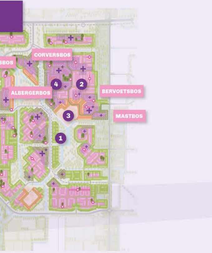
Diverse buurten en wijken 1. ... Groen stedelijk wonen langs groene en gezonde corridors. 2. ... Compact buurtsaam wonen in de buurten van de wijk 3. ... Wonen nabij voorzieningen centraal in de wijk. 4. Corporatiebezit als kans