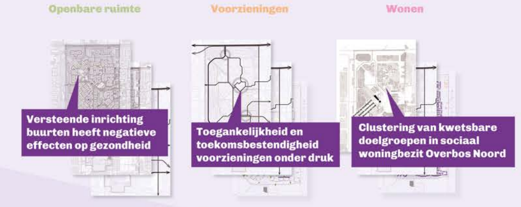
Kaarten: Belangrijkste opgaven per thema