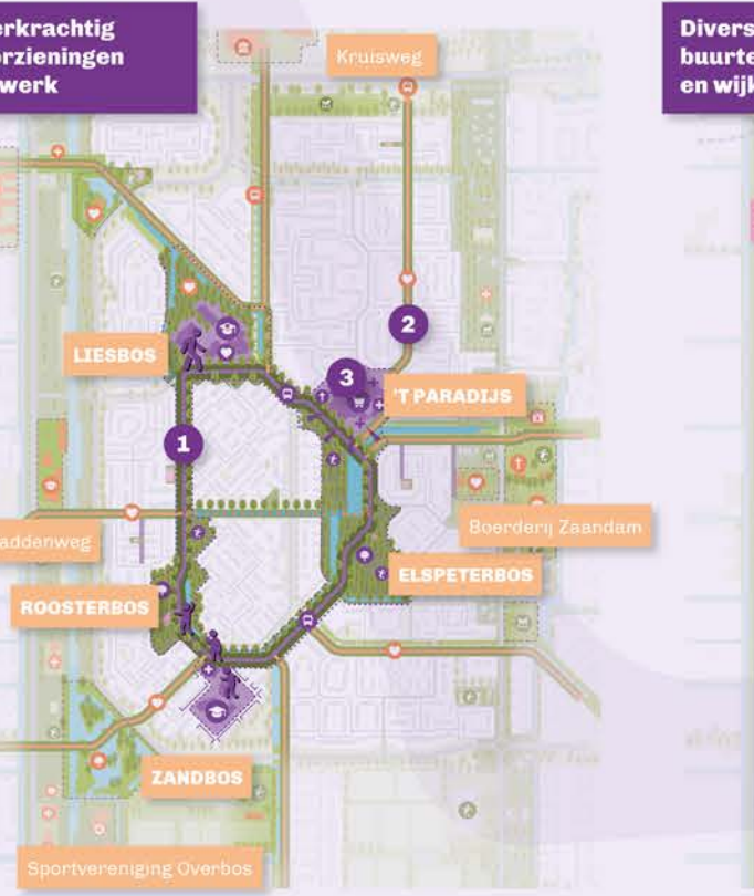
Veerkrachtig voorzieningen netwerk 1. ... Wijkring een trage route met wijkankerpunten. 2. ... Buurtverbindingen trageroutes met buurtankerpunten.