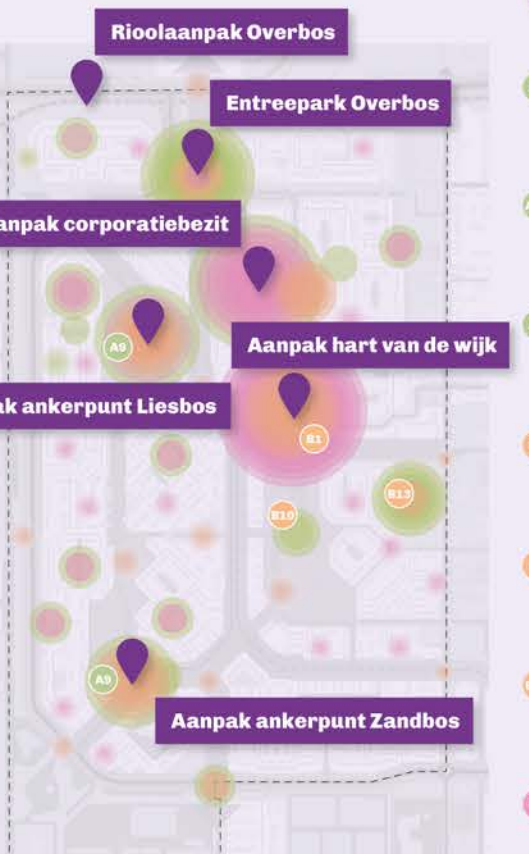
Kaart: projecten kaart met belangrijkste plekken voor quick-wins en grote projecten.