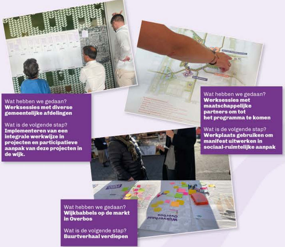
Wat hebben we gedaan? Werkessies met diverse gemeentelijke afdelingen