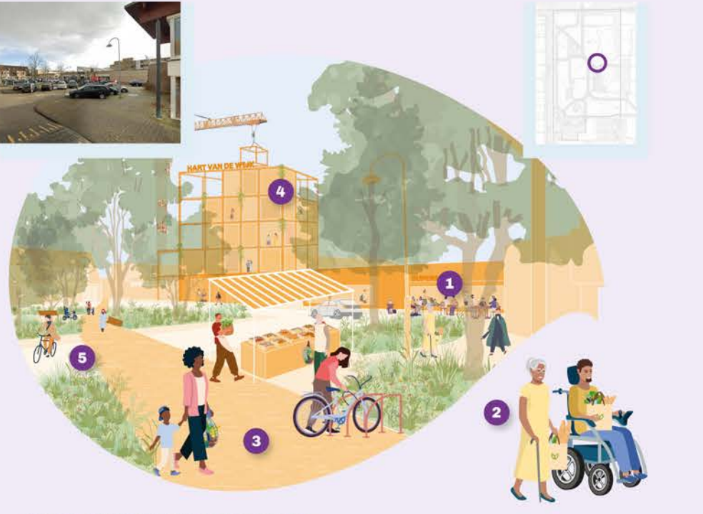
Beeld 2: Een veerkrachtig ankerpunt is... 1. ... divers door verschillende functies in de plint. 2. ... nabij door goede langzaamverkeerverbindingen vanuit alle buurten. 3. ... levendig met kwalitatieve ontmoetingsplekken als hart van de wijk. 4. ... adaptief door flexibel ontwerp met overmaat voor aanpassing o.b.v. behoeftes. 5. ... veilig door voetgangers en fietsers op één te zetten.